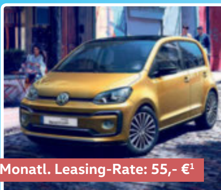
Monat. Leasing-Rate: 55,- €¹