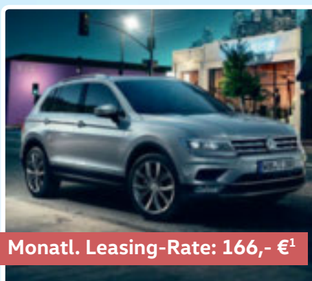
Monat. Leasing-Rate: 166,- €¹